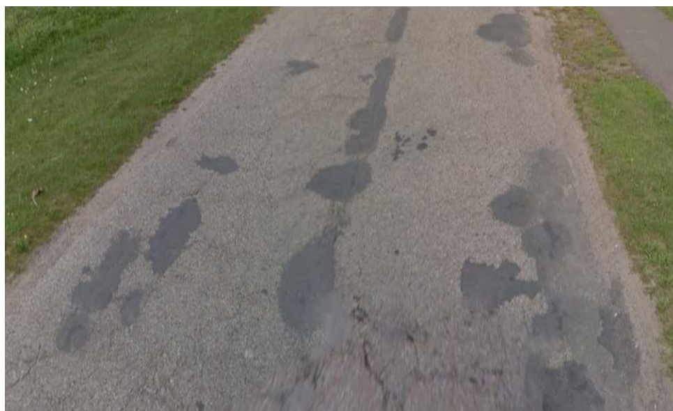
Zdjęcie nr 5